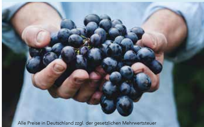
Alle Preise in Deutschland zzgl. der gesetzlichen Mehrwertsteuer